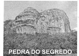
PEDRA DO SEGREDO

CNPJ: 88.142.302/0001-45 - Fone/fax: (55) 3281 1351 - Rua XV de Novembro, 438 - 96570-00 - Caçapava do Sul - RS