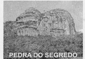
PEDRA DO SEGREDO

CNPJ: 88.142.302/0001-45 - Fone/fax: (55) 3281 1351 - Rua XV de Novembro, 438 - 96570-00 - Caçapava do Sul - RS