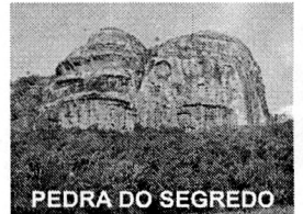
PEDRA DO SEGREDO

CNPJ: 88.142.302/0001-45 - Fone/fax: (55) 3281 1351 - Rua XV de Novembro, 438 - 96570-00 - Caçapava do Sul - RS