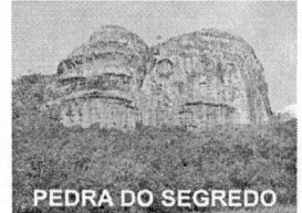
PEDRA DO SEGREDO

CNPJ: 88.142.302/0001-45 - Fone/fax: (55) 3281 1351 - Rua XV de Novembro, 438 - 96570-00 - Caçapava do Sul - RS