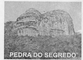
PEDRA DO SEGREDO

CNPJ: 88.142.302/0001-45 - Fone/fax: (55) 3281 1351 - Rua XV de Novembro, 438 - 96570-00 - Caçapava do Sul - RS