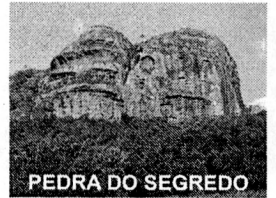
PEDRA DO SEGREDO

CNPJ: 88.142.302/0001-45 - Fone/fax: (55) 3281 1351 - Rua XV de Novembro, 438 - 96570-00 - Caçapava do Sul - RS