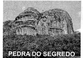
PEDRA DO SEGREDO

CNPJ: 88.142.302/0001-45 - Fone/fax: (55) 3281 1351 - Rua XV de Novembro, 438 - 96570-00 - Caçapava do Sul - RS