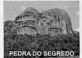
PEDRA DO SEGREDO

CNPJ: 88.142.302/0001-45 - Fone/fax: (55) 3281 1351 - Rua XV de Novembro, 438 - 96570-00 - Caçapava do Sul - RS