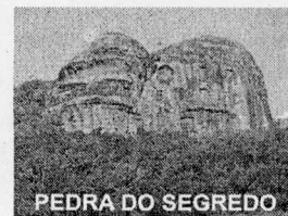
PEDRA DO SEGREDO

CNPJ: 88.142.302/0001-45 - Fone/fax: (55) 3281 1351 - Rua XV de Novembro, 438 - 96570-00 - Caçapava do Sul - RS