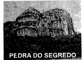
PEDRA DO SEGREDO

CNPJ: 88.142.302/0001-45 - Fone/fax: (55) 3281 1351 - Rua XV de Novembro, 438 - 96570-00 - Caçapava do Sul - RS