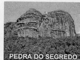
PEDRA DO SEGREDO

CNPJ: 88.142.302/0001-45 - Fone/fax: (55) 3281 1351 - Rua XV de Novembro, 438 - 96570-00 - Caçapava do Sul - RS