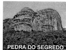
PEDRA DO SEGREDO

CNPJ: 88.142.302/0001-45 - Fone/fax: (55) 3281 1351 - Rua XV de Novembro, 438 - 96570-00 - Caçapava do Sul - RS