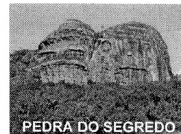
PEDRA DO SEGREDO

CNPJ: 88.142.302/0001-45 - Fone/fax: (55) 3281 1351 - Rua XV de Novembro, 438 - 96570-00 - Caçapava do Sul - RS