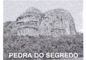
PEDRA DO SEGREDO

CNPJ: 88.142.302/0001-45 - Fone/fax: (55) 3281 1351 - Rua XV de Novembro, 438 - 96570-00 - Caçapava do Sul - RS