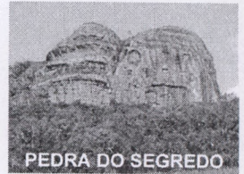
PEDRA DO SEGREDO

CNPJ: 88.142.302/0001-45 - Fone/fax: (55) 3281 1351 - Rua XV de Novembro, 438 - 96570-00 - Caçapava do Sul - RS