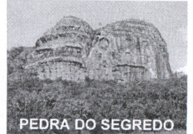
PEDRA DO SEGREDO

AUTORIZA O PODER EXECUTIVO A ABRIR CRÉDITO ADICIONAL SUPLEMENTAR E DÁ OUTRAS PROVIDÊNCIAS.