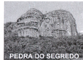
PEDRA DO SEGREDO

CNPJ: 88.142.302/0001-45 - Fone/fax: (55) 3281 1351 - Rua XV de Novembro, 438 - 96570-00 - Caçapava do Sul - RS