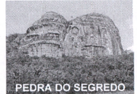
PEDRA DO SEGREDO

CNPJ: 88.142.302/0001-45 - Fone/fax: (55) 3281 1351 - Rua XV de Novembro, 438 - 96570-00 - Caçapava do Sul - RS