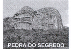
PEDRA DO SEGREDO

CNPJ: 88.142.302/0001-45 - Fone/fax: (55) 3281 1351 - Rua XV de Novembro, 438 - 96570-00 - Caçapava do Sul - RS