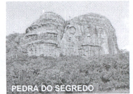
PEDRA DO SEGREDO

CNPJ: 88.142.302/0001-45 - Fone/fax: (55) 3281 1351 - Rua XV de Novembro, 438 - Caçapava do Sul - RS