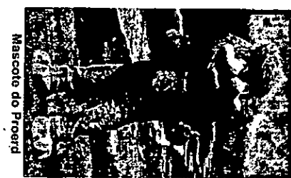
Mascote do Proerd

O Proerd no Rio Grande do Sul é desenvolvido desde 1998, quando a Brigada Militar formou, na Polícia Militar de São Paulo, seus primeiros instrutores, iniciando a expansão do programa pelo Estado. Quatro anos depois, seus primeiros mentores foram formados pela Polícia Militar de Santa Catarina. Em 2007 ocorreu a consolidação do Programa com formatura de equipe completa de capacitação pela Polícia Militar de Minas Gerais.