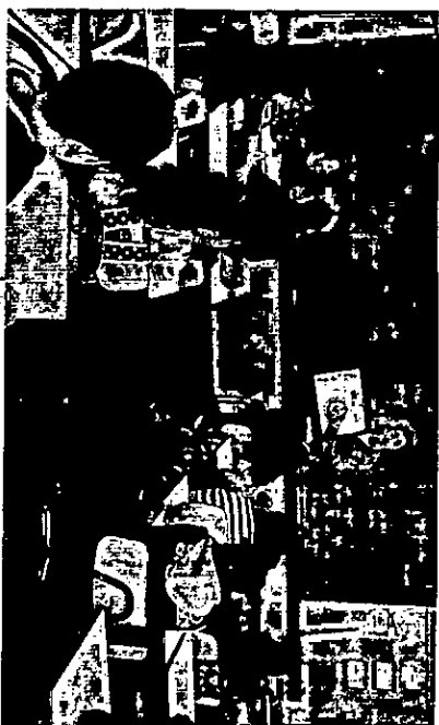
Policial em sala de aula

É importante lembrar que o PROERD é uma ação conjunta entre Brigada Militar e Comunidade, o que nos permite afirmar não ser um programa exclusivo da polícia Militar ou das escolas, mas sim da sociedade. O programa é calcado em uma parceria entre Escola, Brigada Militar e Família, sendo vital o envolvimento de todos.